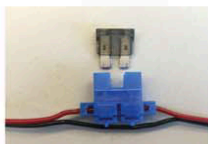
Porte fusible automobile / Automotive fuse holder